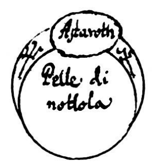
[Fig.6. Astaroth. Pelle di nottola]

Nella 2da mansione della luna, farai fare un anello de piombo, et vi porrai una pietra paragone et vi scriverai questo nome Astaroth, con ago et fatto il scongiuro dirai: Io ti commando Astaroth che farro questo segno in terra sia sempre invisibile a tutte le creature sin tanto, che non dis, faro questo segno; et sin tanto che non disfarai il segno farai in, visibile, onde tutti li segni si devano fare, che non si disfacino.