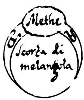
[Fig. 10.Methe. Scorza di melangola]

Per ottenere quasivoglia gratia da qualsivoglia persona.