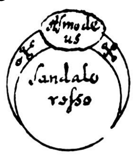
[Fig.14.Asmodeus. Sandalo rosso]

Per guarire ogni sorte de infirmita di febre.