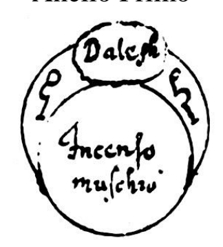
[Fig.4.Daleph. Incenso muschio]