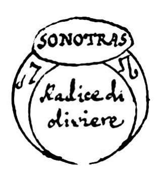
[Fig.20.Sonotras. Radice di oliviere]

Nella 9. mansione della luna farai fare un anello di piombo e vi porrai gemma di colore negro, e scritto il nome Sonotras et fatto lo scongiuro dirai: Io ti commando Sonotras che subito fatto questo segno in terra la tale N. persona s'infermi di talo N. male, ne possa guarire sin che io non quasto detto segno, e quando vuoi, che sara disfarai il segno, come si fa in tutti li altri et opera come sopra.