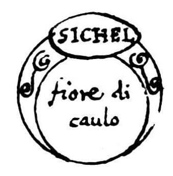
[Fig.22. Sichel. Fiore di caulo.]