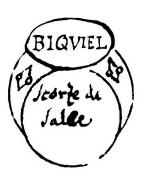
[Fig.26. Biqviel. Scorze de salce. Hic est annulus 11]

Per non essere preso da Nemici della Justitia.