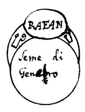
[Fig.30. Rafan. Seme di genebro]

Nella 14. Mansione della luna farai fare un Anello di ferro et vi porrai gemma granata, rossa et scritto Rafan et fatto lo scongiuro dirai io ti commando Rafan che fatto