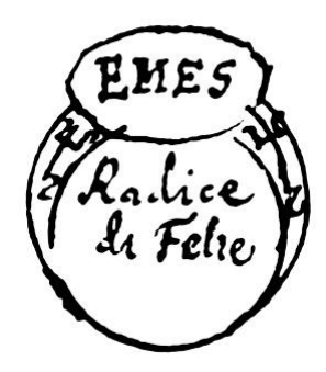
[Fig.18.Emes. Radice de Felie]

Nella 8 mansione della luna farai fare un anello di argento, e vi porrai pietra granata et scritto a torno Emes, et fatto il scongi, uro dirai: Io ti commando Emes che subito che faro questo segno in terra et fin tanto che no disfara possi pigliare tutti quelli pesci ch'voglio. E tornato dalla caccia si disfara il segno, et cosi si deve fare di tutti.