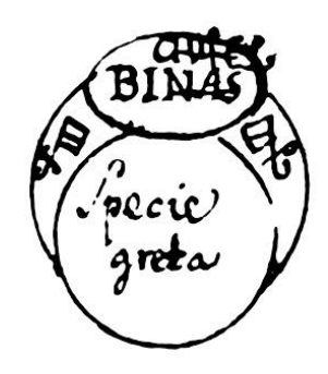
[Fig.24. BINASQVIEL. Specie greta. Hic est annulus 12]

Nella 11ma mansion della luna farai fare un anello d'argento e vi porrai una gemma e scritto Biqviel, e fatto lo scongiuro come sopra, dirai io ti commando Biqviel che subito, che sara fatto questo segno in terra con questo anello la tale N. persona si addor, menti e dormi sin, che io disfare questo segno e disfatto restera di dormire come farai in tutti li altri anelli.